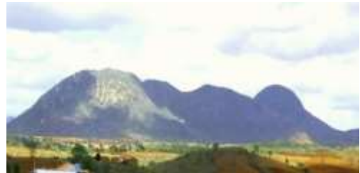
SERRA DE CATURITÉ

A Serra de Caturité fica no Povoado de Pedra D'água, município de Caturité, com aproximadamente 900 metros de altitude o Pico do Caturité é o 3º mais alto do estado da Paraíba, ele abrange os vilarejos de Serraria e Pedra D'água, mas o melhor acesso a subida fica por Pedra D'água, que tem sido muito visitado, por esportistas, arqueólogos, e os que só preferem a trilha em buscar de admirar as belas paisagens. Fica aqui a sugestão de passeio em um fim de semana ou feriado.