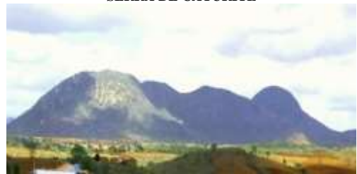
SERRA DE CATURITÉ

A Serra de Caturité fica no Povoado de Pedra D'água, município de Caturité, com aproximadamente 900 metros de altitude o Pico do Caturité é o 3º mais alto do estado da Paraíba, ele abrange os vilarejos de Serraria e Pedra D'água, mas o melhor acesso a subida fica por Pedra D'água, que tem sido muito visitado, por esportistas, arqueólogos, e os que só preferem a trilha em buscar de admirar as belas paisagens. Fica aqui a sugestão de passeio em um fim de semana ou feriado.